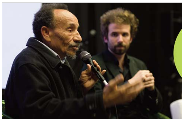
Conférences de Pierre Rabhi

Au total, ce sont plus de 25.000 personnes qui ont assisté à divers rassemblements (colloques, tables rondes et conférences) auxquels Pierre Rabhi a participé.